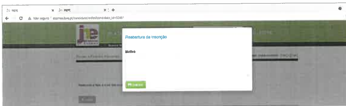
Figura 3 – Indicar o motivo do pedido de reabertura da inscrição